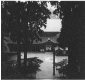
総門文殊楼から根本中堂をみる

開創者は、伝教大師最澄。最澄は比叡山に入って草庵を結んだ3年後の788年(延暦7)、山上にみずから刻した薬師如来を安置した小堂(一乗止観院といわれた)を営み、比叡山寺と名づけた。延暦寺は年号を寺名とした